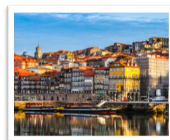
Cidade do Porto

Petit-déjeuner à l'hôtel et départ vers Mafra, et visite du couvent , monastère érigé selon les vœux de João V. C'est l'un des plus beaux édifices baroques du Portugal. Départ vers la petite ville médiévale d'Óbidos , dominée par son château avec quatre portes d'entrée, ses rues étroites pavées et sinueuses, qui fut jusqu'en 1833 l'apanage des Reines. Dégustation de Ginginha (liqueur typique de la région) servi dans un verre de chocolat. Après, départ pour la visite du Monastère de Santa Maria da Vitória à Batalha . Magnifique édifice, l'un des plus beaux monuments du style gothique manuelin d'Europe : Chapelles Inachevées, Portail Monumental, Cloître Royal finement ciselé dans la pierre dorée, forment un ensemble étonnant de beauté. Déjeuner au restaurant. L'après-midi, découverte de la ville d' Alcobaça , visite de l' église de l'Abbaye Cistercienne , où se trouvent les tombeaux du Roi D. Pedro I (le cruel) et de D. Inês de Castro, la Reine couronnée après sa mort. Départ vers Penela . Installation dans un hôtel 3*/4*. Dîner et nuit à l'hôtel.