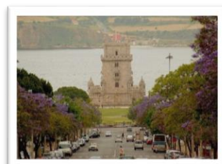
Torre de Belem

Accueil par un représentant de Pinhal Tour à l'aéroport de Lisbonne. Nous découvrirons ensemble, le quartier de Belém , dont les nombreux et prestigieux monuments, rappellent le siècle des grandes découvertes maritimes : le Monument des Découvertes , l'élégante Tour de Belém (extérieur), forteresse du XVème bâtie sur le Tage, le Musée des Carrosses qui regroupe la plus grande collection de carrosses du monde et l' Église du Monastère des Hiéronymites , témoignage de remerciement pour la découverte par Vasco da Gama de la route des épices menant aux Indes. Dégustation du fameux Pastel de Belém dans une prestigieuse pâtisserie de la capitale. Déjeuner au restaurant. Tour panoramique par la Place du Commerce, la fameuse avenue de la Liberté et Place Marquês de Pombal . Installation dans un hôtel 3*/4*. Dîner et nuit à l'hôtel.